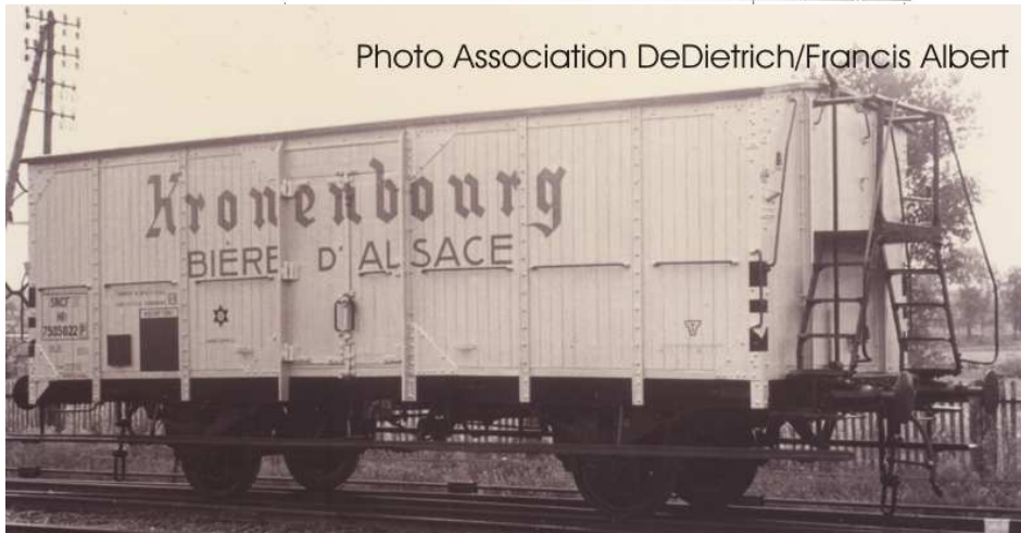
K246 même wagon que K245, déco Kronenbourg lettres rouges caisse blanche SNCF50