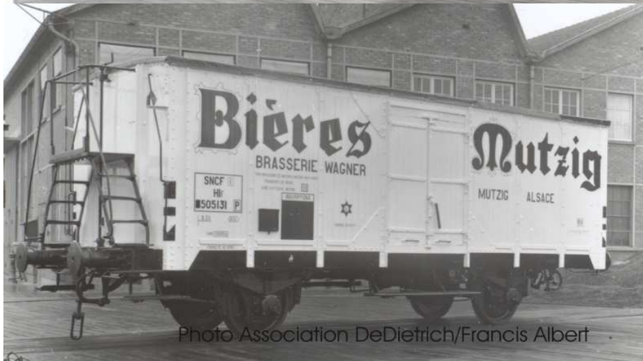
K248 caisse renforcée, grandes portes, plateforme de guérite haute, boîtes d'essieux AL, tampons OCEM déco Mutzig AL, SNCF38 et SNCF50