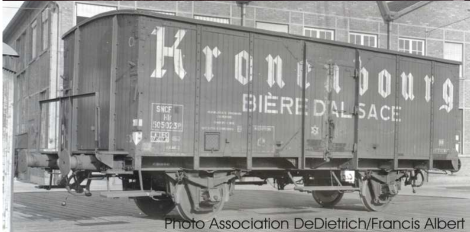
K247 caisse renforcée, plateforme serre frein basse, tampons et boîtes d'essieux OCEM déco Kronenbourg lettres blanches caisse rouge SNCF50